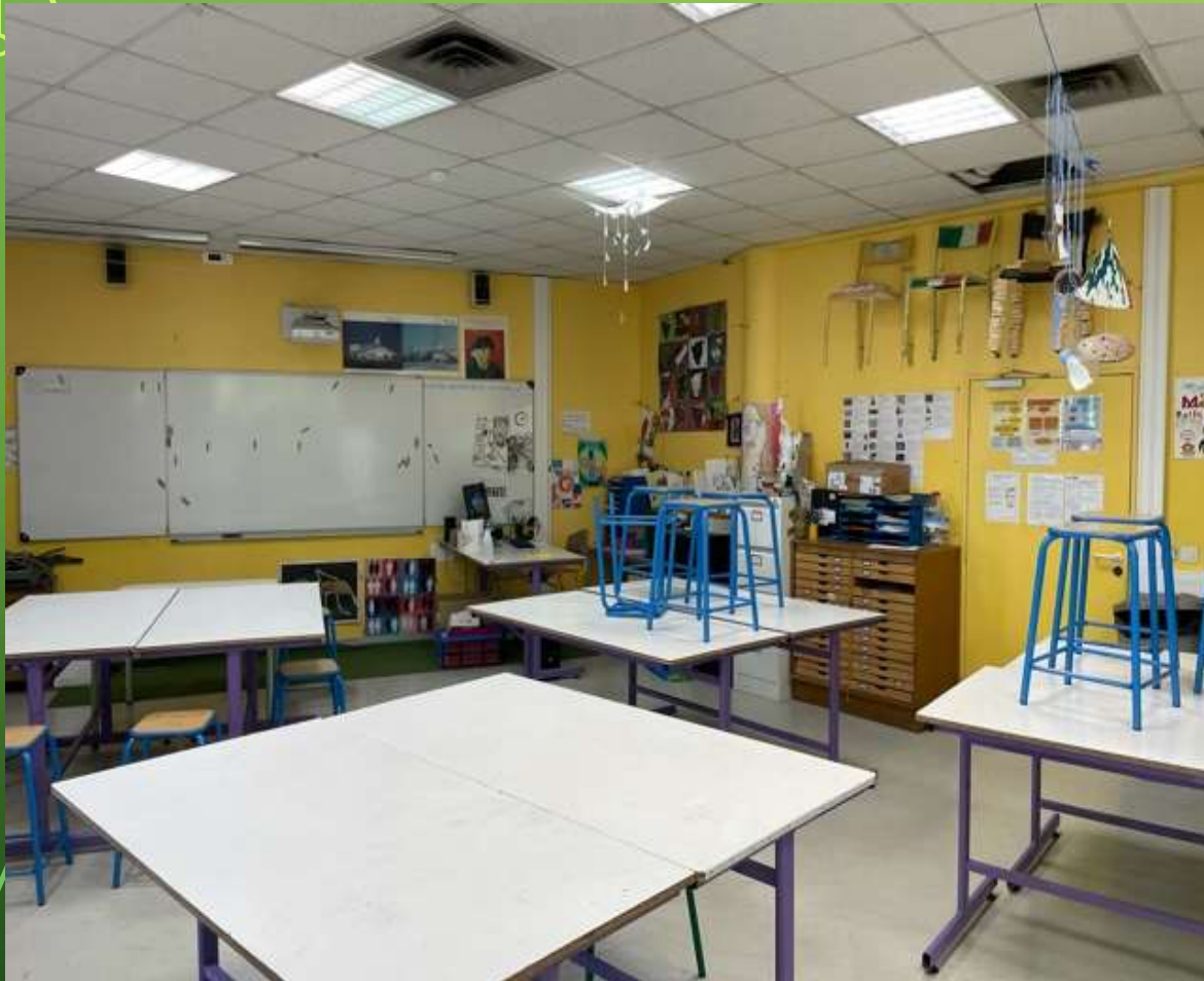
Salles d'arts plastiques