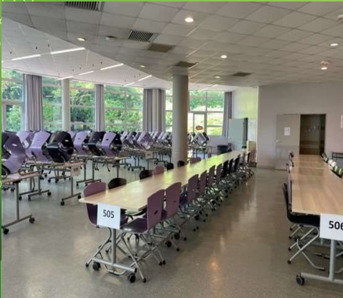
SALLE DE RESTAURATION