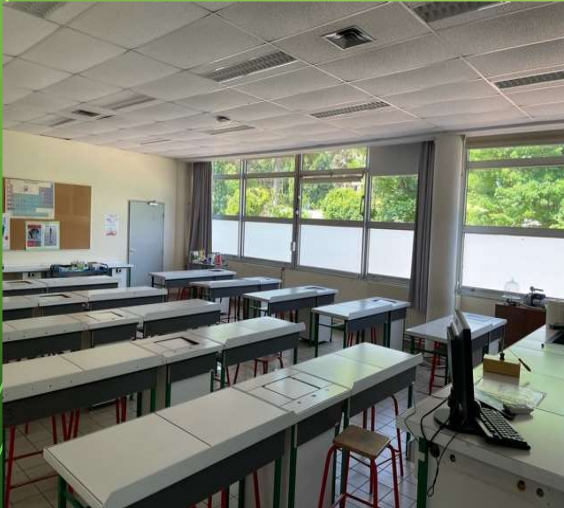
Salles de sciences